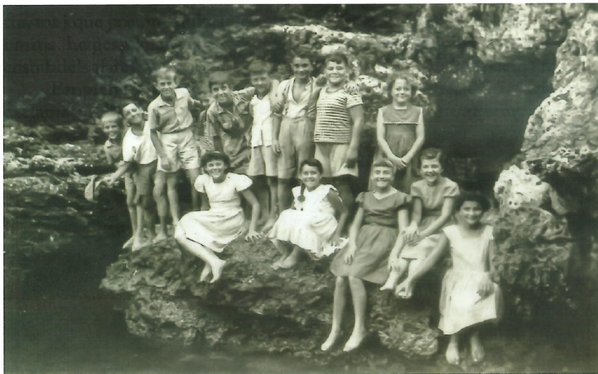
L'alegra cridèria infantil retronava entre les roques de la seductora caleta de Rafalet.