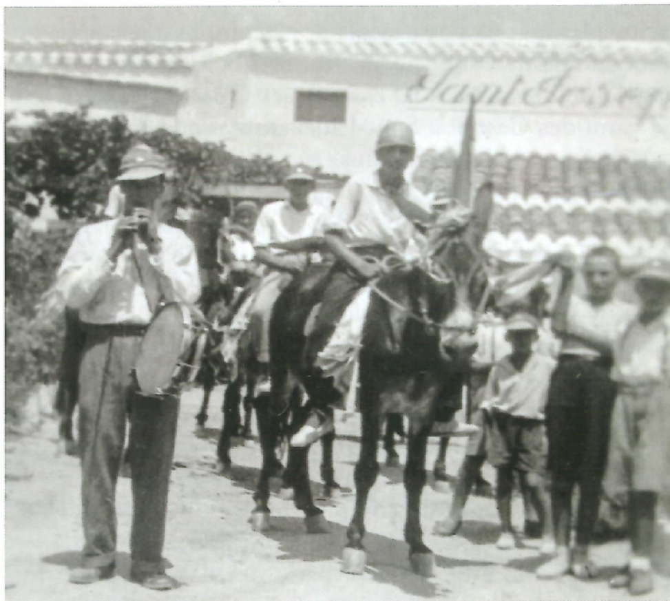
Qualcada d'ases a les festes de Trebalúger dels anys cinquanta al seu pas per davant Sant Josep.

Durant mig segle Trebalúger comptà com a element vertebrador amb l'escola rural, que en una segona etapa també complí funcions de capella. Però encara són molts més els factors que han conformat la personalitat col·lectiva de Trebalúger al llarg dels anys, alguns dels quals vaig provar de sintetitzar en dos articles de premsa. 56 Podríem esmentar el pou