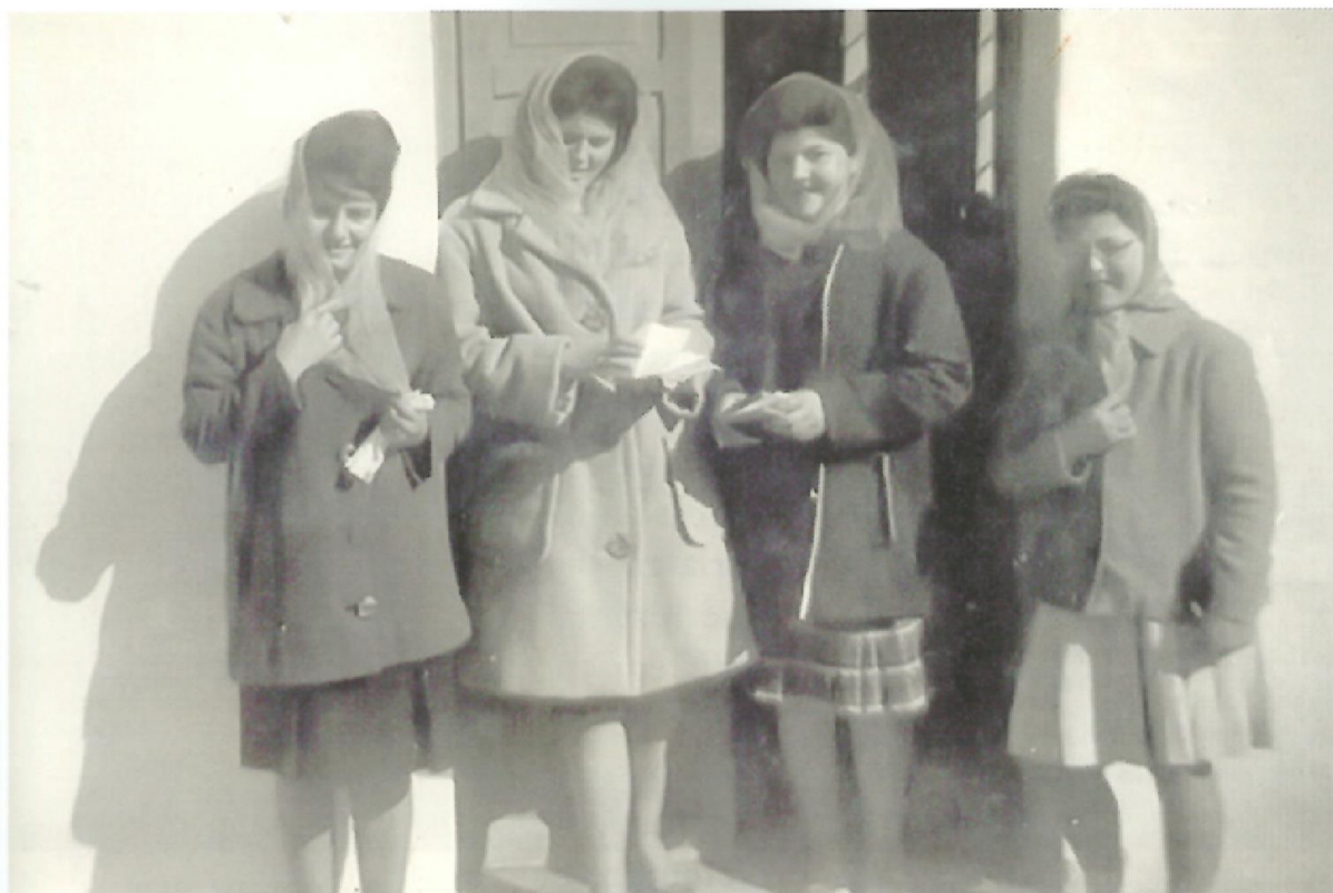
Jovenetes de Trebalúger amb la mantellina a la sortida de missa dominical.