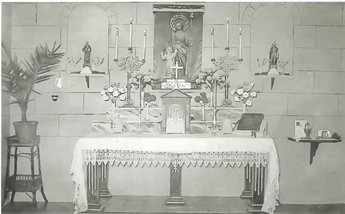
Altar de la capella amb la imatge de sant Josep entronitzada al centre.